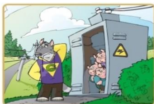
Не лезь на электроустановки и в трансформаторные будки

Опасно для жизни влезать на опоры линий электропередачи, проникать в трансформаторные подстанции или подвалы, где находятся электрические провода