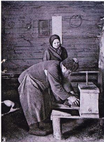
Медовитский промысел, Богородского уезда. Формовка крестов и иконок.